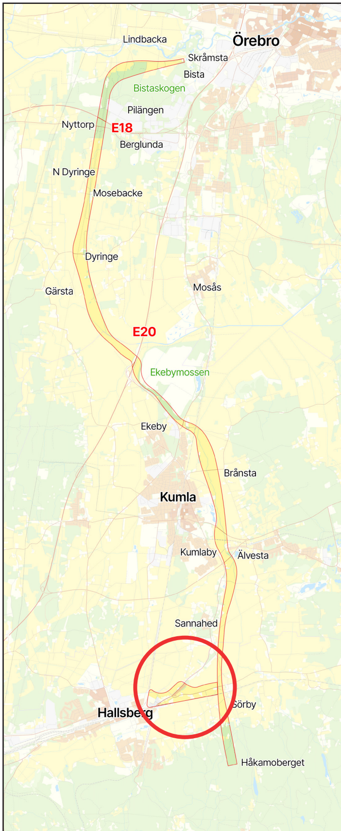
Utredningsområde för planerat vattenledningssystem med tillägg i Hallsbergs kommun inom röd ring.